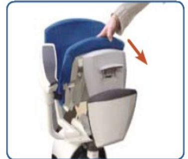
Obrázek 4: Rozkládání sedačky

Sedačka je ve stanicích připravena ve složené poloze (viz obrázek 4).