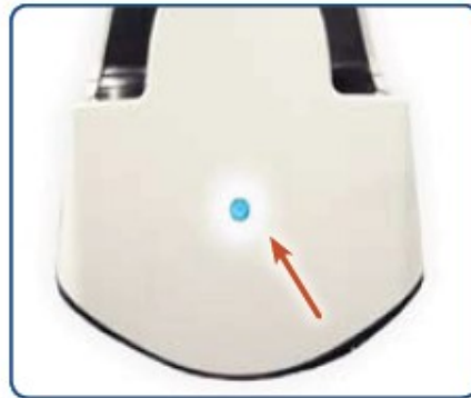
Kontrolka na krytu

Hlavním vypínačem můžete po zatažení a držení pomalu dojet do spodní zastávky pokud dojde k poruše a sedačka zůstane stát uprostřed schodů. Za vypínač je nutno zatáhnout a držet jej, dokud sedačka nedojede do požadované polohy.