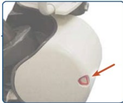
Hlavní vypínač sedačky

Hlavní spínač slouží k zapnutí či vypnutí schodišťové sedačky Flow2 (například když jedete na dovolenou či nebudete delší dobu doma). Kontrolka na krytu pohonné jednotky ukazuje, že je sedačka zapnutá a připravená k použití. Když se sedačka vypne, přestane kontrolka svítit.