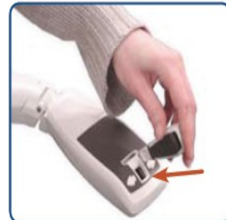
Obrázek 3: Vložení joysticku do ovladače na sedačce