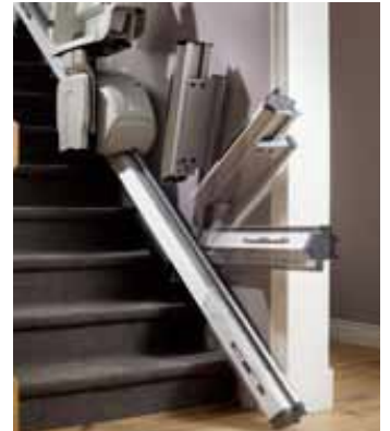
Obrázek 5: Sedačka Flow2 s automaticky sklápnou dráhou