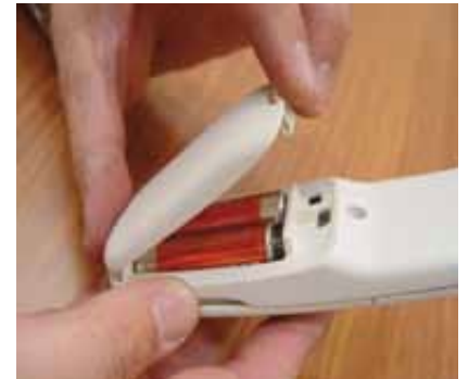
Obrázek 6: Výměna baterií v přivolávači