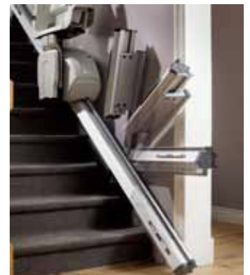
Obrázek 5: Sedačka HomeGlide s automaticky sklopnou dráhou