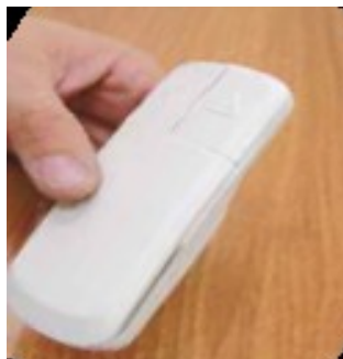
Obrázek 2: Bezdrátové přivolávače

Bezdrátové přivolávače (viz obrázek 2) jsou umístěny v držadlech připevněných na zdi, a to jak na vrcholu schodů, tak i dole pod schody. Těmito ovladači můžete sedačku přivolat dle potřeby buď dolů, nebo nahoru.